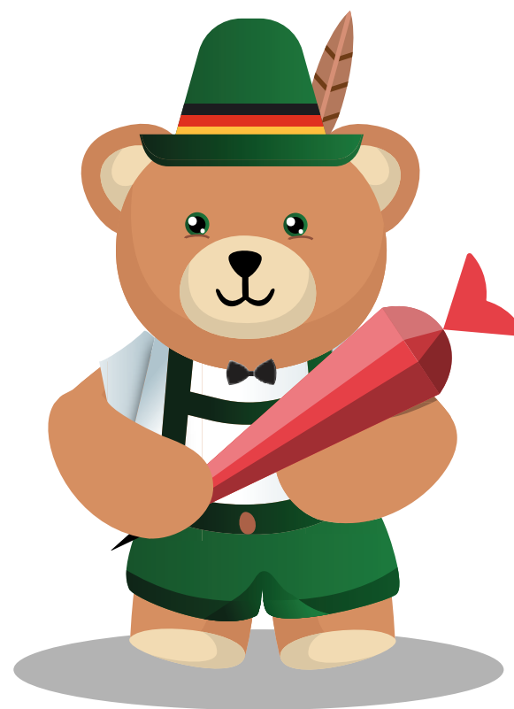
Teddybär Mascote do Colégio Martinus

O cone escolar é uma tradição na Alemanha desde o século XIX. Como o início da vida escolar é um momento muito importante para pais e alunos, e a criança espera ansiosamente pelo seu primeiro dia de aula, os pais, no ano seguinte (1º ano do EF), dão a seus filhos a Schultüte para aliviar a tensão e deixar esse dia ainda mais especial.